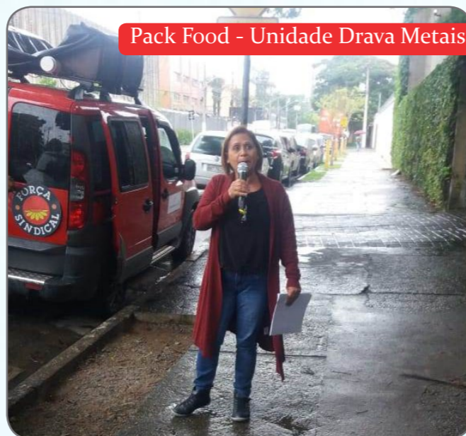
Pack Food - Unidade Drava Metais