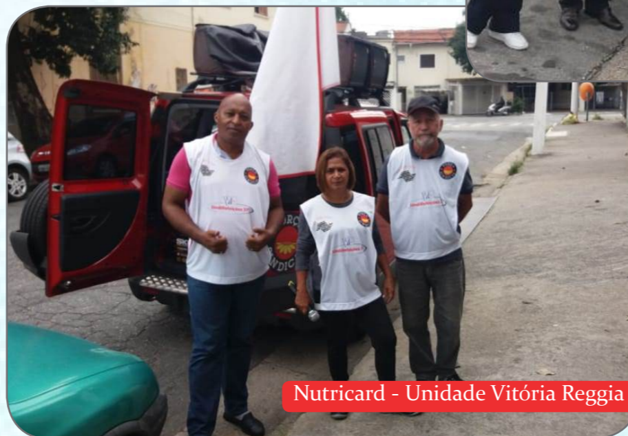
Nutricard - Unidade Vitória Reggia