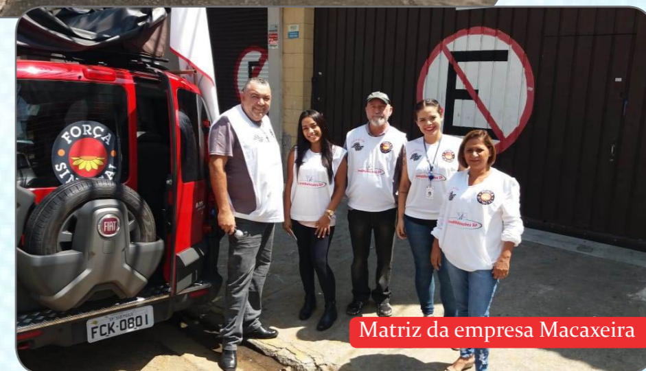
Matriz da empresa Macaxeira