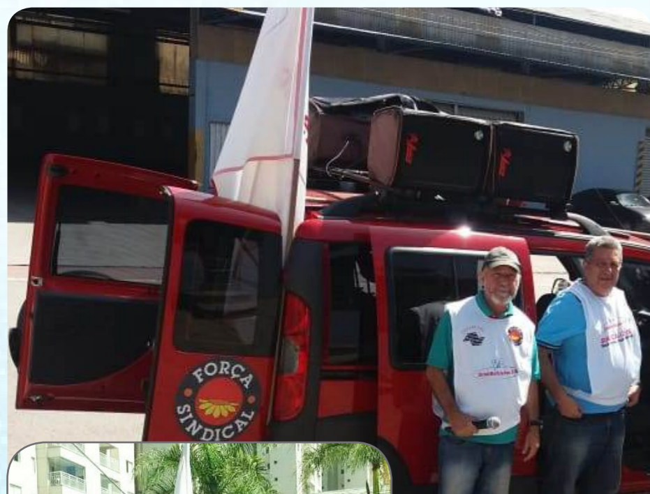
Empresa Rodney Felicio - Box 57, Unidade Danúbio Azul Transportes de Cargas e Encomendas

Ao longo do mês, todos os dias o Sindicato, por meio da equipe de Mobilização, vai na porta das Matrizes de várias empresas, ou dos clientes, para sanar as divergências apresentadas quanto ao cumprimento das obrigações com os trabalhadores. O carro de som com a equipe de mobilização fica na porta da empresa até resolver as reivindicações. O que traz êxito. Confira algumas fotos dos atos realizados: