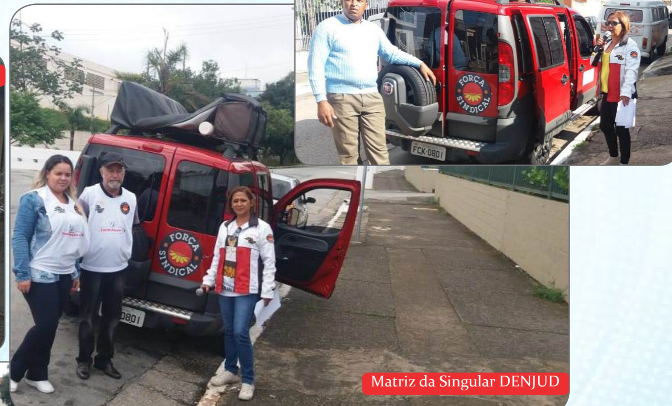
Matriz da Singular DENJUD