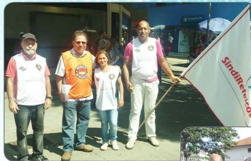
Lançamento do 1º de Maio Unificado - Centrais Sindicais, realizado em frente ao Teatro Municipal de São Paulo - Praça Ramos de Azevedo.